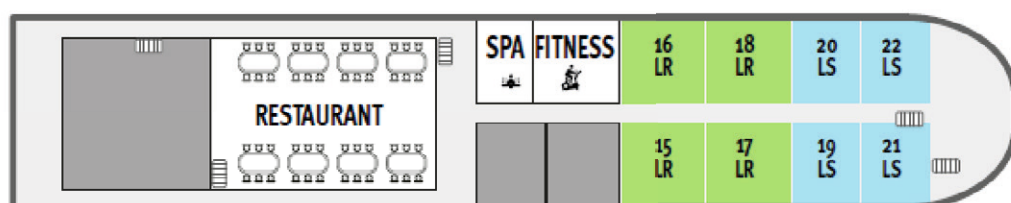
Pont Principal ■ Deluxe Baie vitrée (18 m 2 ) ■ Confort Baie vitrée (14 m 2 )

LR : 2 lits rapprochables / LS : grand lit simple