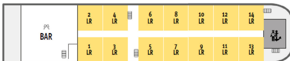
Pont Supérieur ■ Deluxe Baie vitrée (18 m 2 )